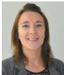
Mot de la directrice générale